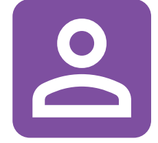
Servicios y Recursos Humanos