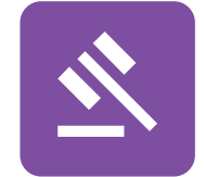
Derecho, Seguridad Pública, Correcciones y Seguridad