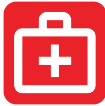
Ciencias de la Salud