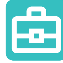
Empresa, Mercadotecnia y Gestión