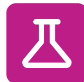
Ciencia, Tecnología, Ingeniería y Matemáticas

Cada uno de los seis campos profesionales se divide en 1-4 subgrupos, denominados "clusters". Cada grupo está compuesto por una serie de ocupaciones y carreras postsecundarias relacionadas con la especialidad de ese grupo. Los resultados de tus evaluaciones de intereses y habilidades de OKCareerGuide están vinculados a estos mismos clusters.