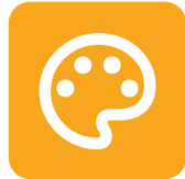
Artes, Tecnología Audiovisual y Comunicaciones