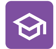
Educación y Formación