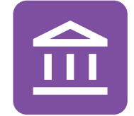
Gobierno y Administración Pública