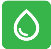
Agricultura, Alimentación y Recursos Naturales