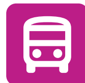
Transporte, Distribución y Logística