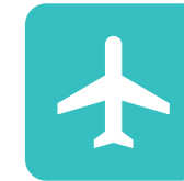
Hostelería y Turismo