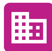
Arquitectura y Construcción