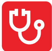
Ciencias de la Salud