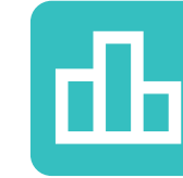
Gestión y Administración de Empresas