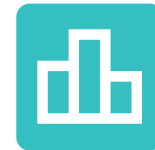
Gestión y Administración de Empresas