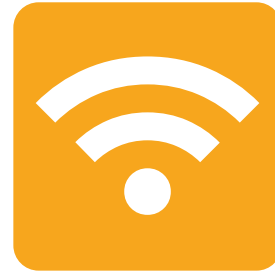
Sistemas de Comunicación e Información