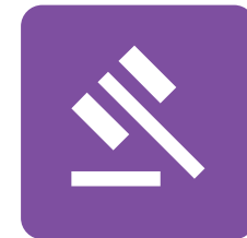
Derecho, Seguridad Pública, Correcciones y Seguridad