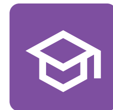
Educación y Formación