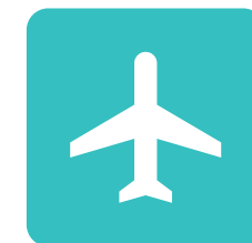
Hostelería y Turismo