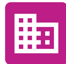
Arquitectura y Construcción