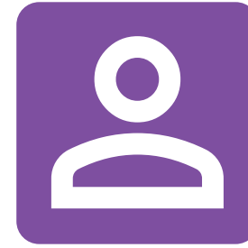
Servicios y Recursos Humanos