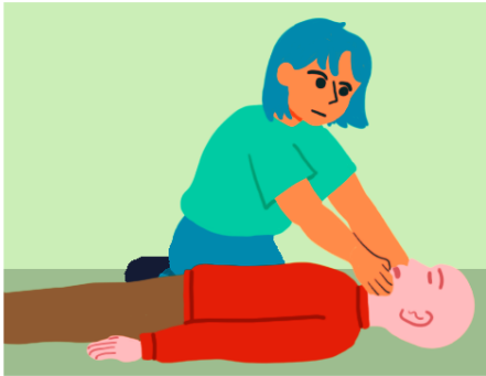
Abrir las vías aéreas