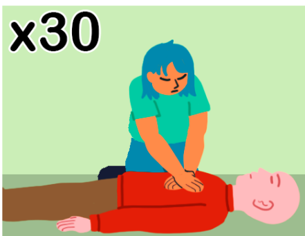
30 compresiones torácicas