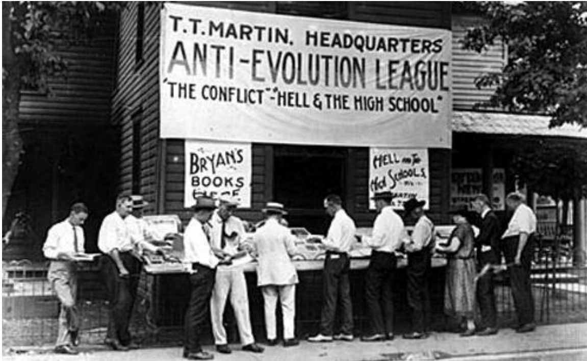
Licht, M. (1925). Liga Anti-Evolución, en el juicio de Scopes, Dayton Tennessee de Literary Digest, 25 de julio de 1925.

Nota: El evangelista T. T. Martin de Mississippi dio conferencias en las esquinas y vendió copias de su popular libro, “El infierno y las escuelas preparatorias” (extracto de abajo), durante el juicio de Scopes en 1925: