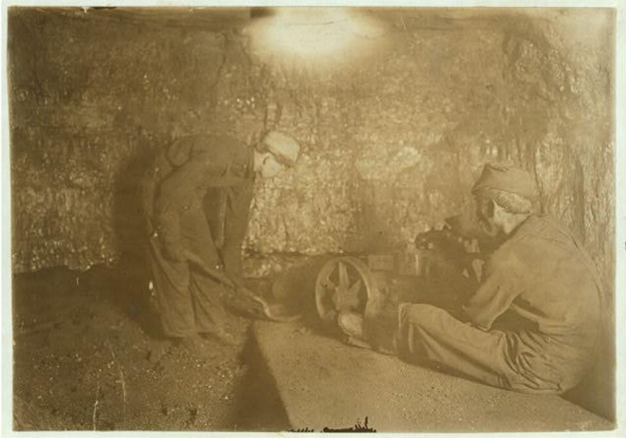
Hombre con una máquina perforadora [preparándose] para perforar el carbón. El chico palea 10 [horas] diarias. Red Star, Virginia Occidental.

Biblioteca del Congreso (s.f.). Comité Nacional del Trabajo Infantil, n.º 69. Hombre con una máquina perforadora para perforar carbón. Un chico palea 10 horas diarias, mina Laura, Red Star, Virginia Occidental. Ubicación: Red Star, Virginia Occidental. Biblioteca del Congreso, División de Impresiones y Fotografías, Washington D.C. 20540, EE. UU. Extraído de https://hdl.loc.gov/loc.pnp/nlc.01048