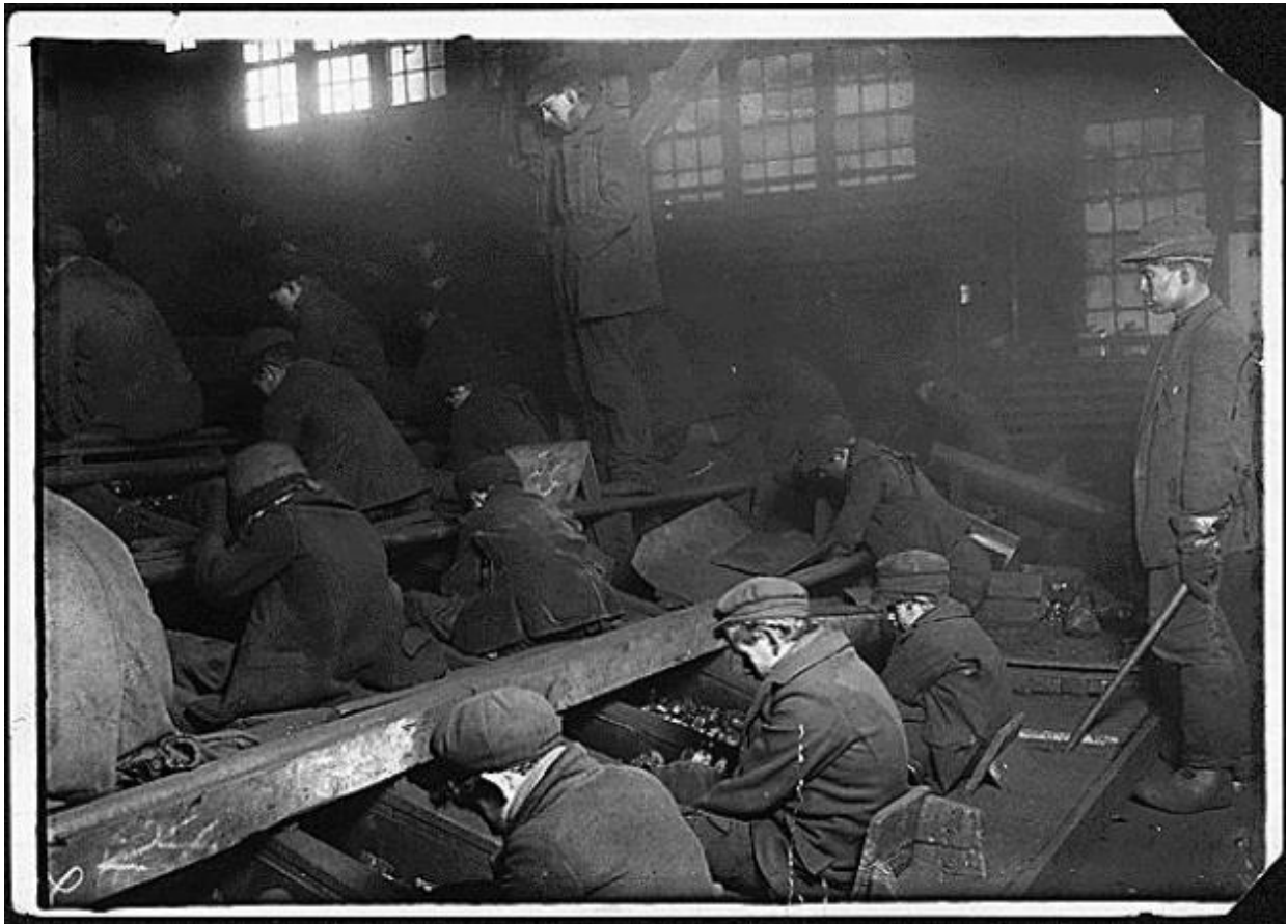
Vista de la Quebradora Ewen de Pennsylvania Coal Co. El polvo era tan denso a veces que oscurecía la vista. Este polvo penetró en lo más profundo de los pulmones de los chicos. A veces, una especie de explotador de esclavos se pone al lado de los chicos, empujándolos o dándoles patadas para que obedezcan. Pittston, Pensilvania, 1911.

Hine, L. (1912.). Vista de la Quebradora Ewen de Pennsylvania Coal Co. El polvo era tan denso a veces que oscurecía la vista. Este polvo penetró en lo más profundo de los pulmones de los chicos. A veces, una especie de explotador de esclavos se pone al lado de los chicos, empujándolos o dándoles patadas para que obedezcan. S. Pittston, Pensilvania. Catálogo de los Archivos Nacionales. Extraído de https://catalog.archives.gov/id/523378