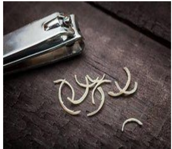
Recortes de uñas de los pies