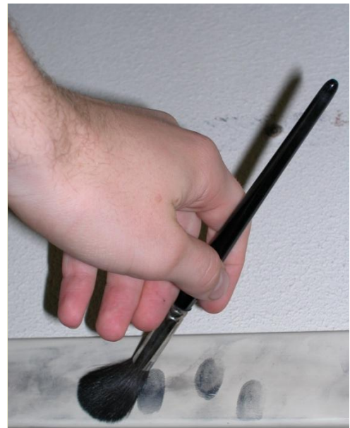
Tomando huellas dactilares